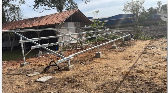
Entrega das Placas