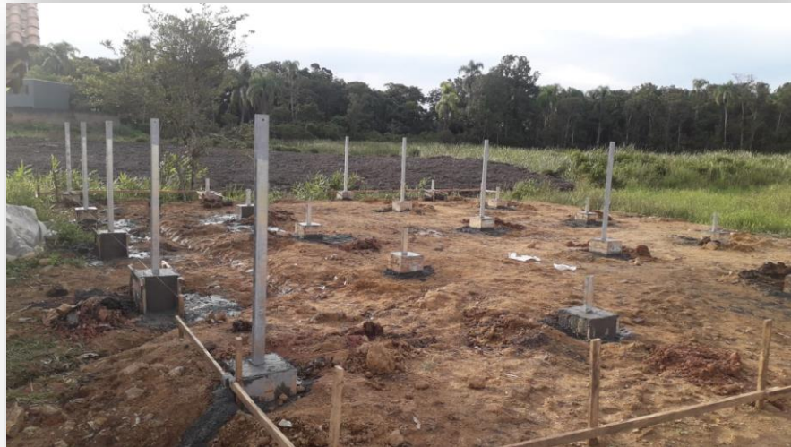
Estrutura das Placas